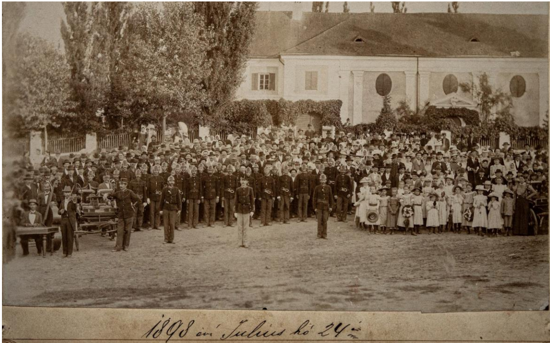
A kastély előtti téren a Tűzoltó Egyesület és a település lakó láthatók.