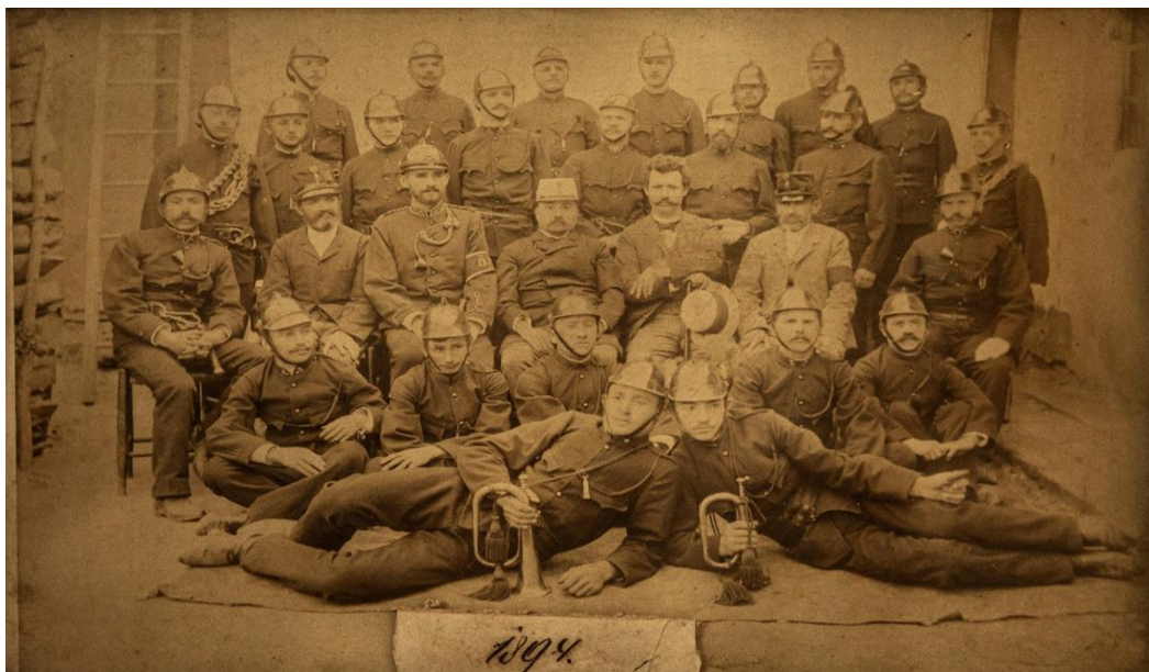
Sellyei tűzoltó egyesület 1894-ben készült fotográfiája.