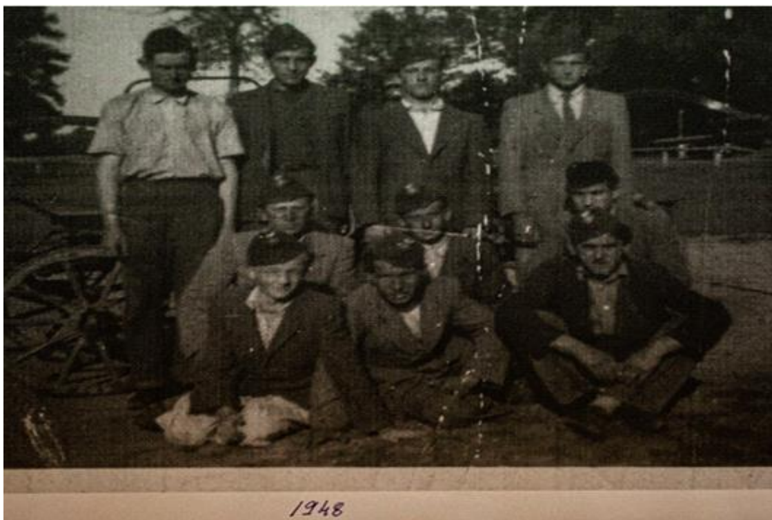
1948-as önkéntes tűzoltók egy csoportja.

A fennmaradt dokumentumok tanúsága szerint évente átlagosan 70— 80 alkalommal vonultak , ezzel folyamatosan biztosítva a település és környéke biztonságát.