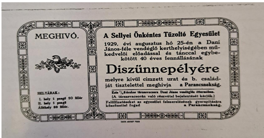
Meghívó a díszünnepélyre 1929.8.25. napjára.