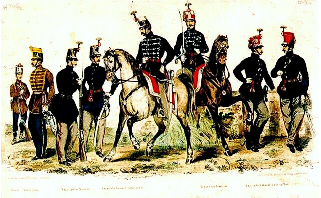
A nemzetőri viseletről készült színezett nyomtatvány

Az 1848. évi XXII. törvénycikk nemzetőrségi szolgálatra kötelezte azokat a 20 és 50 év közötti férfiakat, akik 200 forint értékű házzal, földdel, illetve fél jobbágytelekkel vagy ezzel megegyező nagyságú földterülettel rendelkeztek, vagy jövedelmük elérte évente a 100 forintot. 1948 nyarától figyelmen kívül hagyták a belépéskor a vagyoni cezúrát, és elfogadták az önként jelentkezőket is, így alakultak ki a nemzetőrség mozgó zászlóaljai.