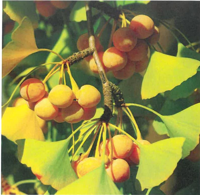
A páfrányfenyő kettős maghéjú magja.