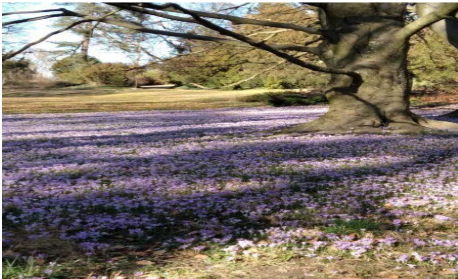
A sellyei óriásfa közel 200 éve élhet a Draskovich-kastély parkjában. Az ország egyik legidősebb és legnagyobb páfrányfenyője a kerti pihenőtől nem messze magasodik.

A páfrányfenyőfélék már a perm időszakban is léteztek, kb. 270 millió évvel ezelőtt jelentek meg a Földön mára azonban ez az egyetlen fajuk maradt, mely a jégkorszakot is túlélte. A páfrányfenyőkővület-felfedezések megmutatják, hogy a mezozoikum óta a nedves, mérsékelt meleg éghajlatok alatt élt. A jelenleg élő páfrányfenyő megközelítőleg 50 millió évvel ezelőtt alakult ki, azóta szinte változatlan. Kínában őshonos faj. Egyes szakirodalmi adatok szerint a buddhista szerzeteseknek köszönhető a fennmaradása, de mint később kiderült, vadon élő állományai is fennmaradtak. A korábbi Csung-dinasztia XI. századi írásos forrásaiból kiderült, hogy a fa vadon is előfordul Kelet-Kína területén, Csangcsiangtól (Jangce-folyó) délre, főként a Tianmu-hegységben. Kaifeng fővárosban ritka és értékes árucikk volt egykor, őshazájából a császárnak évente szállították, mert sarcot, adót fizettek vele. A fát eleinte a leveleinek alakja miatt Ya Chió-nak nevezték, mely kacsalábat jelent. Később, mikor a magját a fővárosban megismerték, már Yin Hsingnek, vagyis ezüst baracknak is nevezték. Későbbiekben megtelepítették a fővárosban — ez volt az első adat az őshonos előfordulásán kívül, majd innen terjedt el az egész országban. Jelentős szerepe volt a festészetben és a költészetben is. A Csung-dinasztia szerzői nem nagyon említik, hogy művelésén kívül délen is megtalálható Anhujban.